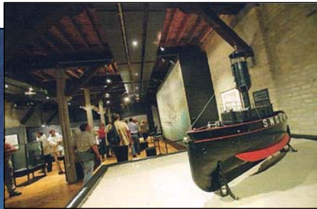
↑ Musée de la Marine.