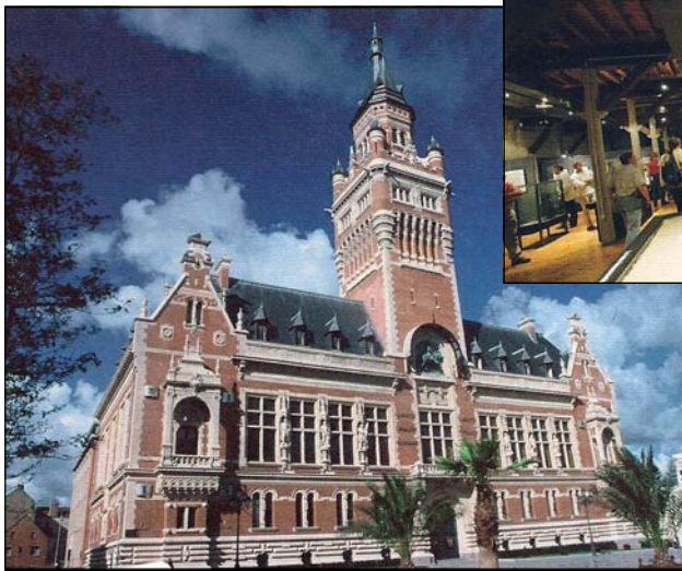
Hôtel de Ville.